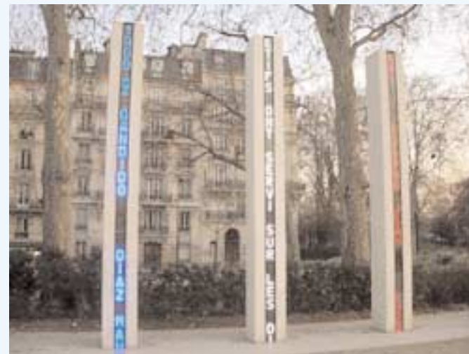
Le Mémorial National de la guerre d'Algérie (1952-1962) et des combats du Maroc et de la Tunisie. Quai Branly - Paris 7ème arrondissement.

Article 2 de la Loi n° 2005-158 du 23 février 2005.