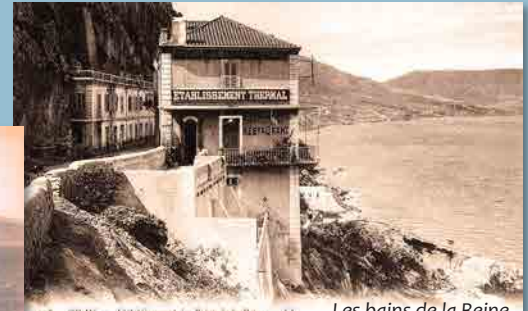
1905 ORAN. — L'édification des Bains de la Reine. — E.L. Les bains de la Reine