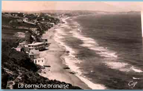
La corniche oranaise