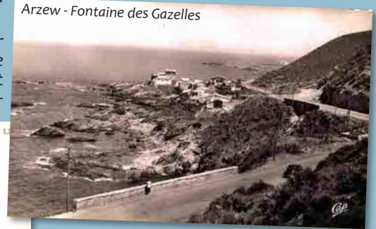
Arzew - Fontaine des Gazelles

nelle de la peste, Rieux savait que Tarrou se disait, comme lui, que la maladie venait de les oublier, que cela était bien, et qu'il fallait maintenant recommencer. (.../...)