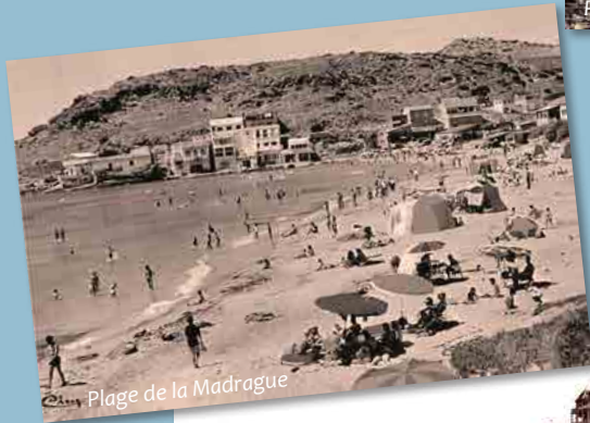
Plage de la Madrague