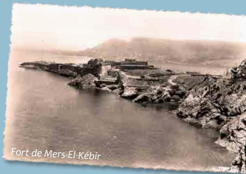
Fort de Mers-El-Kébir