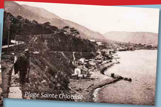
Plage Sainte Chotilde

(.../...) Rieux pensa que Tarrou plaisantait et il le regarda. Mais dans la vague leur qui venait du ciel, il vit un visage triste et sérieux. Le vent se levait à nouveau et Rieux sentit qu'il était tiède sur sa peau. Tarrou se secoua :