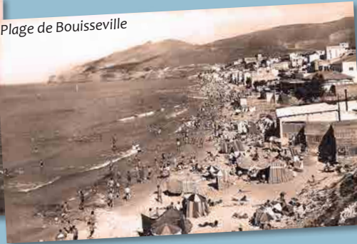
Plage de Bouisville