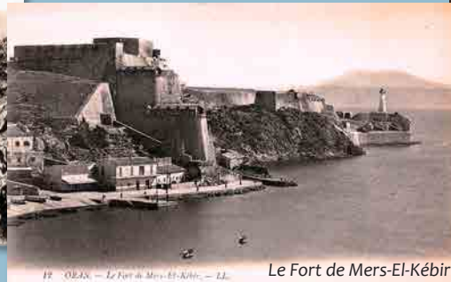
Le Fort de Mers-El-Kébir