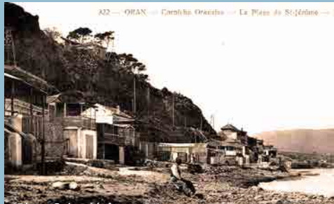
Plage Saint Jérôme